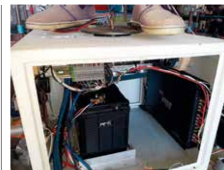
Die platform waarop Jan Gun gemonteer is. 'n Kragtige klankversterker help om Jan se stem te laat bulder, terwyl 'n sonkrag-paneel en battery verseker dat hy 24 uur per dag op sy pos is.